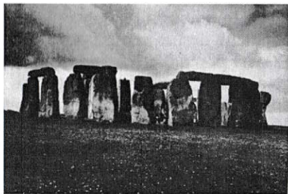
Stonehenge, c.1800-1400 î.Hr.

În decembrie 1993 însă, s-au descoperit lângă Boxgrove, la c.6 mile nord-vest de orașul portuar Bognor Regis (în West Sussex) pe drumul național A27, fragmente de oase de hominid (parțial fosilizate) și toporașe de mână din cultura abbevilliană, cea mai veche cultură "de miez" (c.550.000-440.000) din paleoliticul inferior (prima interglaciație Günz-Mindel). Calculele antropometrice efectuate asupra tibiei (mult mai dezvoltată decât la omul actual) au permis paleoantropologilor să aproximeze înălțimea acestui hominid, cel mai vechi din Europa (o jumătate de milion de ani)*, la 1,83 metri, în timp ce scanarea, prin tomografie computerizată, a aceluiași fragment osos, evidențiind stressuri bio-mecanice, arată că "omul de Boxgrove", carnivor (vânat mare), care nu părea să fi cunoscut focul și îmbrăcămintea, ducea o viață foarte activă și mobilă.