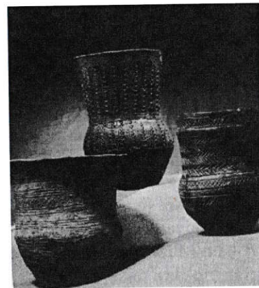
Vase beaker, c.1700 î. Hr.

Spre deosebire de omul paleolitic și mezolitic, care era nomad și vîntor, omul neolitic, ca și cel din epoca bronzului timpuriu era sedentar* și se ocupa cu agricultura, creșterea animalelor, olăritul și prelucrarea metalelor. Perioada a II-a de construcție a monumentului Stonehenge, începută la c. 2100 î.Hr., coincide cu începuturile ceramicii negre 7 în Insulele Britanice: oale, căni, vase de băut răsfrînte la gură – așa-numitele beakers – ultimele, decorate cu motive în zigzaguri și (rar) romburi. Aceste ornamente îndeobște rectilinii și orizontale par să fi fost aduse de așa-numita populație beaker (după numele vaselor din morminte), originară din Peninsula Iberică și coastele Africii de Nord, populație care s-a răspîndit în tot vestul european, dar și în Europa centrală (bazinul Rinului și al Elbei); ele contrastează cu motivele spiralate aduse din zona Mediteranei de enigmaticii constructori de megalitiți. În esență, în insule ca și în restul